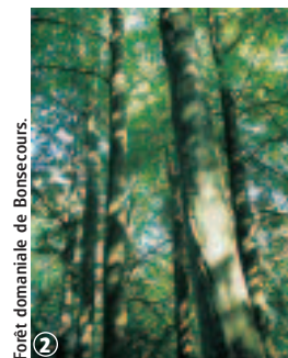
Forêt domaniale de Bonsecours.

L'avis du randonneur : Circuit peu difficile au travers de la forêt transfrontalière de Bonsecours. Cette forêt a été « jardinisée » par le Maréchal de Crôy qui, inspiré par les jardins anglo-chinois, voulait une nature à la fois sauvage et contrôlée. La nature a maintenant repris ses droits mais quelques traces d'histoire subsistent au sein de la forêt. Découvrez également le sentier (pédestre) d'interprétation du Maréchal de Crôy ou la Maison du Parc des Plaines de l'Escaut en Belgique. Les drèves forestières sont boueuses en période de pluie.