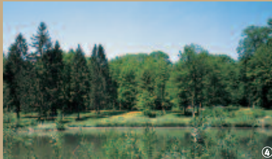
Forêt domaniale de Bonsecours.

chasse. Alexandre de Crôy entreprend les premiers travaux d'un futur parc autour du pavillon ; son idée est de créer « une forêt jardinisée », selon le principe de l'adéquation de l'Homme avec la nature cher au siècle des Lumières.