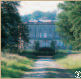
Château de l'Hermitage.

En 1770, le massif forestier devient le grand domaine de l'Ermitage constitué par la famille de Crôy. Il n'y avait alors en lieu et place qu'une forêt et un pavillon de