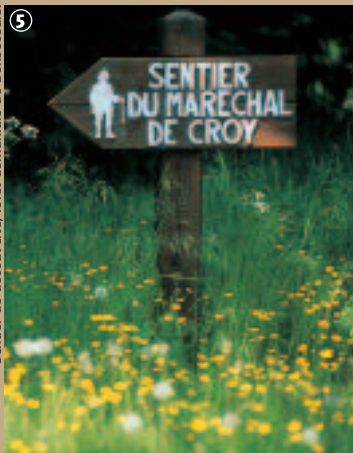
Sentier de découverte, forêt domaniale de Bonsecours.

La famille de Crôy obtint ainsi les louanges de la Cour et demeure célèbre par sa démarche novatrice d'aménagement du paysage. Aujourd'hui forêt domaniale, la nature a repris ses droits. Mais l'empreinte du Maréchal subsiste à travers les essences qu'il a plantées et les allées tracées en étoile autour du château.