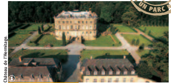
Château de l'Hermitage.

Randonnée VTT Circuit de Bonsecours : 12 km