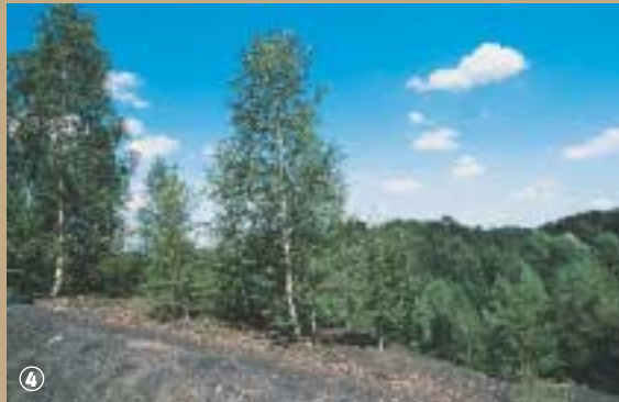
Le bouleau colonise le terril.

pour former l'actuelle mare. La richesse du site réside dans la succession de milieux naturels, de l'eau libre riche en minéraux et plantes aquatiques à la forêt en passant par les roselières constituant un lieu de résidence idéal pour quantité d'oiseaux. En 1968, y fut créée une réserve ornithologique et depuis cette date, plus de 300 espèces d'oiseaux y ont été observées. Tous les groupes d'oiseaux sont représentés : ceux définitivement installés ; ceux qui y font une halte dans leur migration et ceux qui viennent hiverner. Parmi les espèces les plus remarquables, on retiendra le Balbuzard pêcheur, ce rapace de 1,50 m d'envergure, le Grèbe huppé et quantité de canards de surface et plongeurs. Loin de lui faire de l'ombre, le terril plat voisin de la Mare à Goriaux, présente lui aussi un grand intérêt écologique. Depuis quelques an-