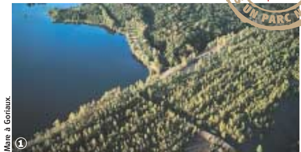
Mare à Goriaux.