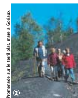
Promenade sur le terril plat, mare à Goriaux.

L'avis du randonneur : Circuit familial qui parcourt des milieux naturels diversifiés : terril plat aux pentes glissantes, étang d'affaissement minier classé en réserve ornithologique, forêt domaniale de Raismes-Saint-Amand-Wallers. La faune et la flore sont riches et variées. Faites preuve de discrétion au sein de ce site remarquable et n'oubliez pas votre paire de jumelles et votre guide de botanique.