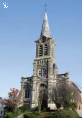
Église de Rombies-et-Marchipont

Des travaux de restauration de la roue et des dents du rouet venus parfaire le tout, le moulin put alors retrouver son ambiance farineuse ! Alors, si vous êtes de passage dans cette petite commune transfrontalière, allez donc découvrir ces deux édifices qui ont traversé le temps, ils valent vraiment le coup d'œil !