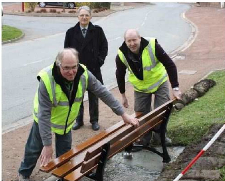
Quatre bancs sont en cours d'installation dans différents secteurs du village, ici sur le trottoir en face de la mairie.

Salle polyvalente. Dans la même logique, des travaux de peinture et d'isolation acoustique vont être effectués. Pour les deux salles, les travaux sont estimés à 45 000 €. « Les dossiers de demande de subvention sont bouclés. Nous devrions être financés par la CAF et la réserve parlementaire du député », souligne Guy Huart. ■