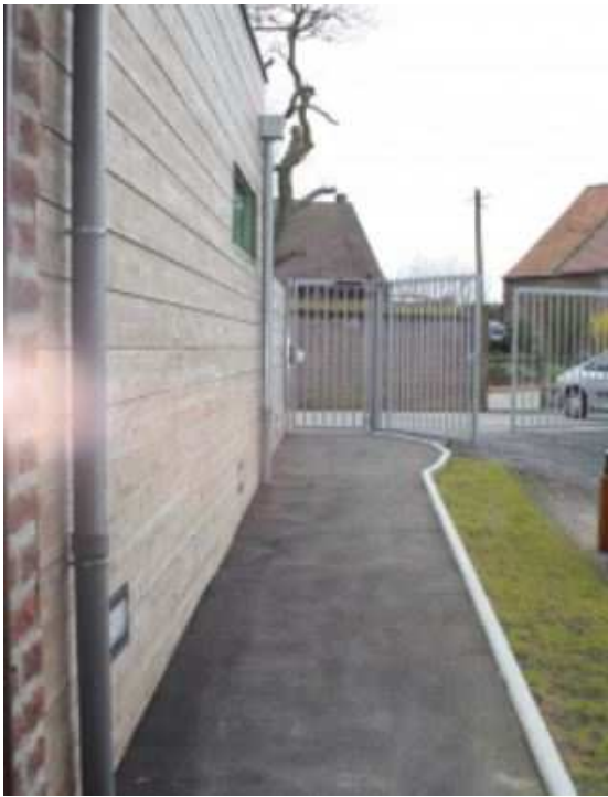
Accès handicapé à l'arrière de la mairie