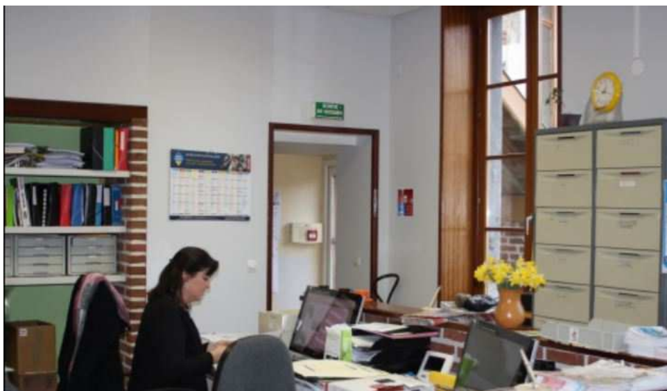
Le secrétariat a fait peau neuve

Article extrait de la Voix du Nord du vendredi 10 avril 2015