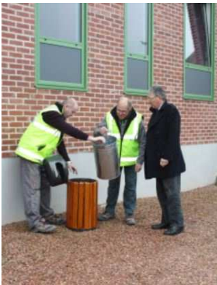
Installation de poubelles